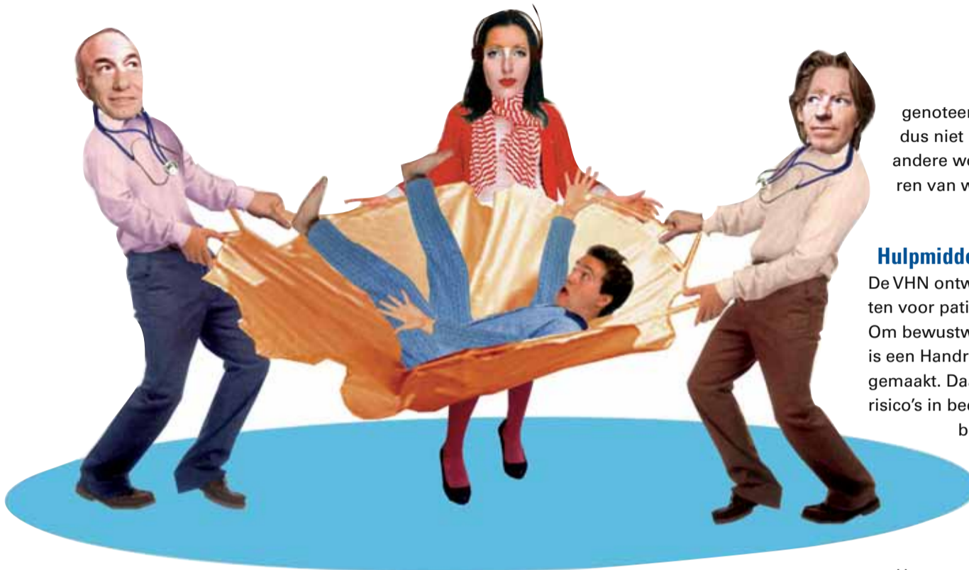
ILLUSTRATIE: ANNET SCHOLTEN

Patiëntveiligheid is belangrijk. Niet voor niets besteden de huisartsenposten er veel aandacht aan. Om ze daarbij te ondersteunen startte de VHN vorig jaar een project Patiëntveiligheid. Onderzoek laat zien welke hulpmiddelen belangrijk zijn.