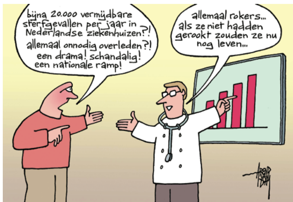
Illustratie Arend van Dam