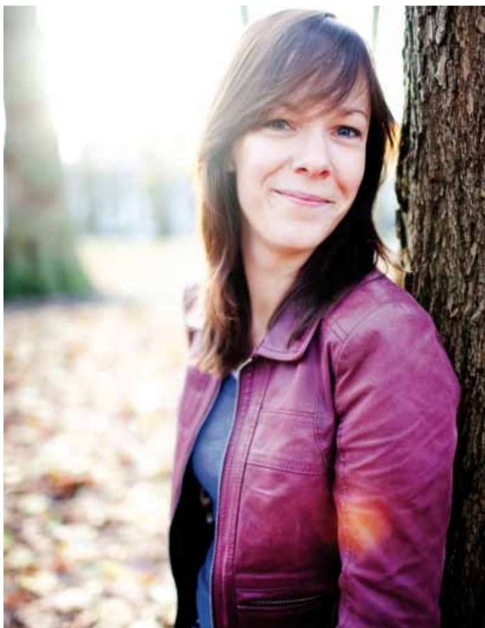
Marieke Wijnjtes fotografie